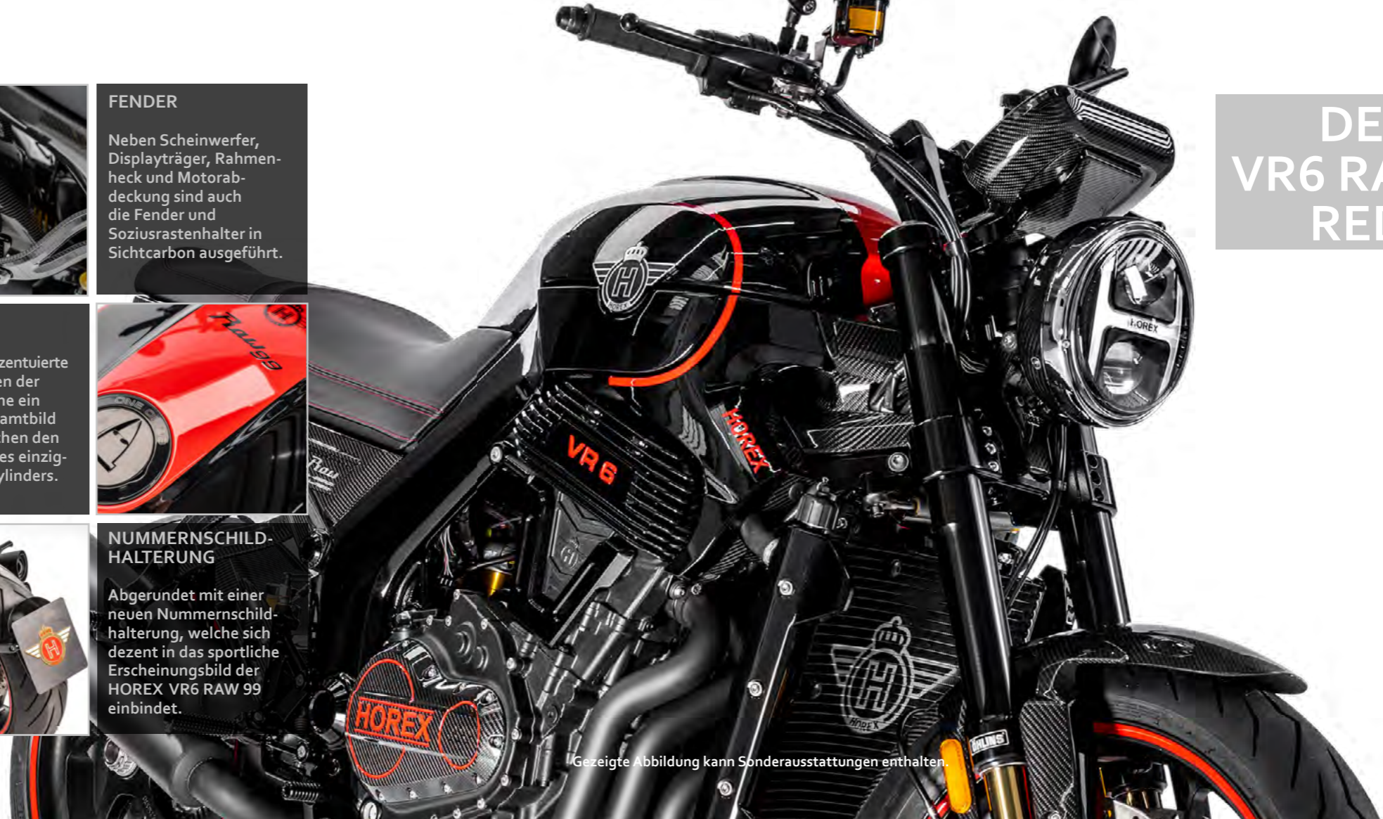
Gezeigte Abbildung kann Sonderausstattungen enthalten.

NUMMERSCHILDHALTERUNG Abgerundet mit einer neuen Nummernschildhalterung, welche sich dezent in das sportliche Erscheinungsbild der HOREX VR6 RAW 99 einbindet.